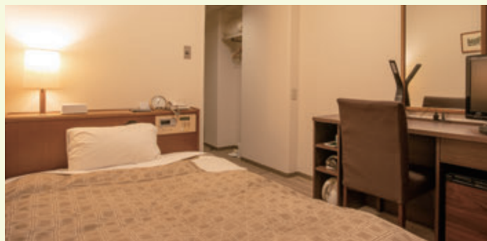
シングルルーム / Single Room (12 ㎡) ※セミダブル (2名様) 仕様に変更可能 (要ご予約)