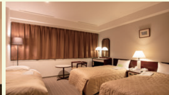
トリプルルーム / Triple Room (24 ㎡)