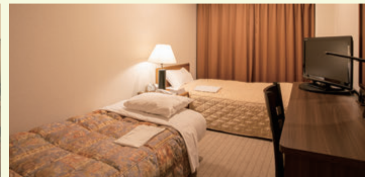
シングルルーム 2 ベッド仕様 / Two beds in a single room (15 ㎡) ※部屋は狭くなりますが、リーズナブルな価格となっています (要ご予約)