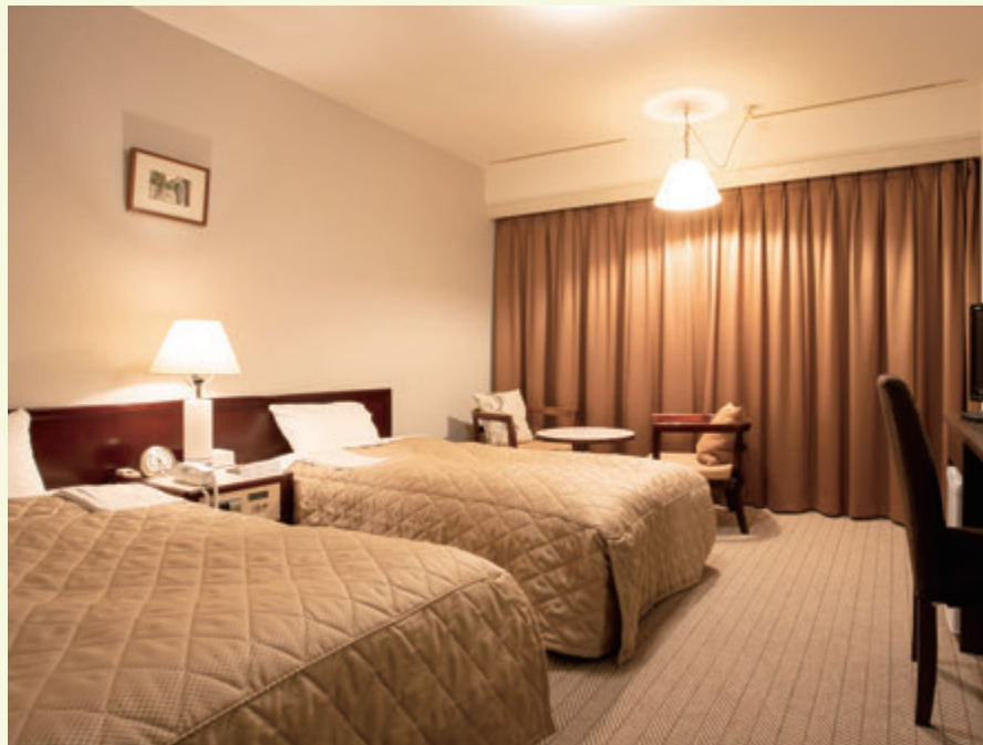
ツインルーム / Twin Room (20 ㎡)